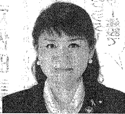
もとむら伸子衆議院議員