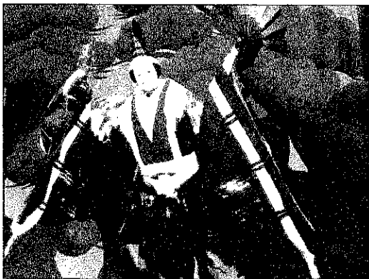
今田の芝居小屋で 浄瑠璃を上演

日本共産党は、社民党や新しくできた立憲民主党とも共闘して、現在の政治を変えようと呼びかけました。 エンジェル トランペット ナス科キダチチョウセンアサガオ属。原産知は熱帯アメリカ。 大きなラッパ状の花がぶら下がるように開花する熱帯花木。熱帯植物ですが、寒さには比較的強く地上部が枯れても地下部から芽が出てきて開花します。 鉢植えでは大株に仕立てないと花が咲かない。すべての部分に毒がある。この花は隣の畑に咲いているのでとらせ