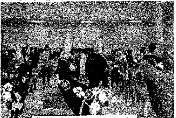
子ども達も一緒に中野音頭

オレンジのTシャツの人がみなさん明るく活動されていました。「恵那市は特に若い人が多い」と、この日出店されていた施設のリーダーからお聞きしました。恵那市の27年度の介護保険特別会計が赤字になったことは皆さんの知恵とエネルギーもその源泉ではなかったかと思えます。国・財務省は来年度から介護報酬の切り下げを打ち出していますがそれは逆で、この若い人たちが安心して結婚でき恵那市の次世代を担っていただけると、支援しなくてはならない。