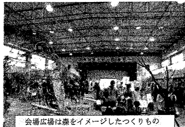
会場広場は森をイメージしたつくりもの