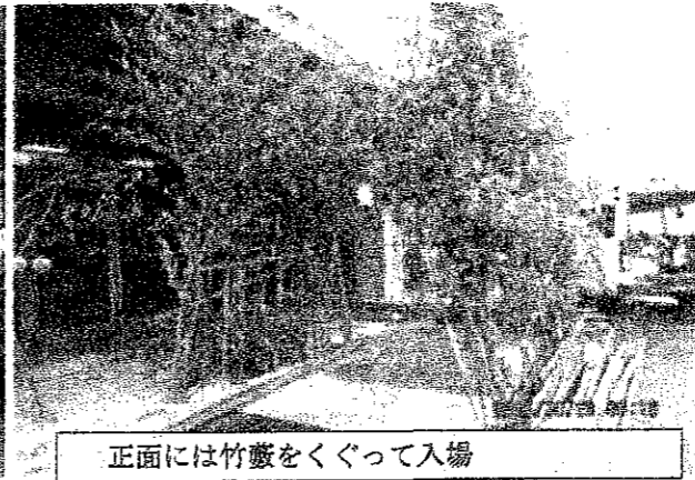
正面には竹藪をくぐって入場

10月28日台風22号の影響で雨模様の中を、恵那市役所前の市民会館を中心に第11回の環境フェアが開催されました。