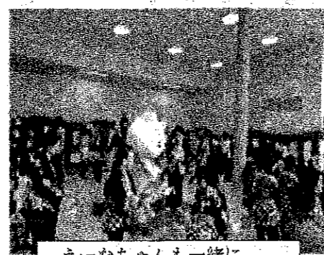
えなちゃんも一緒に