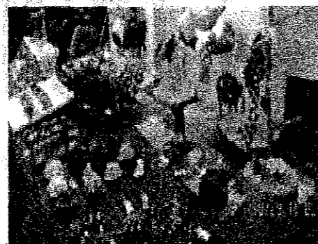
アクセサリーなどフリーマーケット